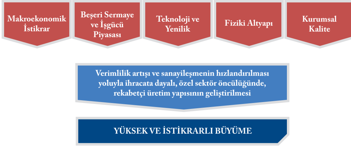
Şekil 1: Büyüme Stratejisi

444. Makroekonomik istikrar, karar alma süreçlerinin ve geleceğe dönük planların sağlıklı biçimde yapılmasına imkan tanımakta ve bu sayede ekonomide kaynakların optimal dağılımla en verimli biçimde değerlendirilmesini mümkün kılmaktadır. Son dönemde sağlanan istikrarın güçlendirilerek korunması Plan hedeflerine ulaşmak açısından ön şart olarak görülmektedir. Bu kapsamda, kamu gelir ve harcamalarında kalitenin artırılmasına yönelik çalışmalar yapılacaktır. Kamu harcamalarının toplam hâsıla içerisindeki payının artırılmamasına ve böylelikle kamunun özel sektörü dışlayıcı etkisinin en aza indirilmesine dikkat edilecektir. Verginin tabana yayılması gibi gelir artırıcı çalışmalarla oluşturulacak mali alan, yeni politikaların uygulanmasına imkân sağlayacaktır. Ayrıca, fiyat istikrarını güçlendirecek para politikası çerçevesi korunacaktır. Bunların yanı sıra, cari açığın kalıcı çözümüne yönelik politika ve önlemler hayata geçirilecektir. Bunlara paralel olarak son on yılda azalma eğilimi gösteren yurtiçi tasarrufların artırılmasına yönelik çalışmalar sürdürülecektir.